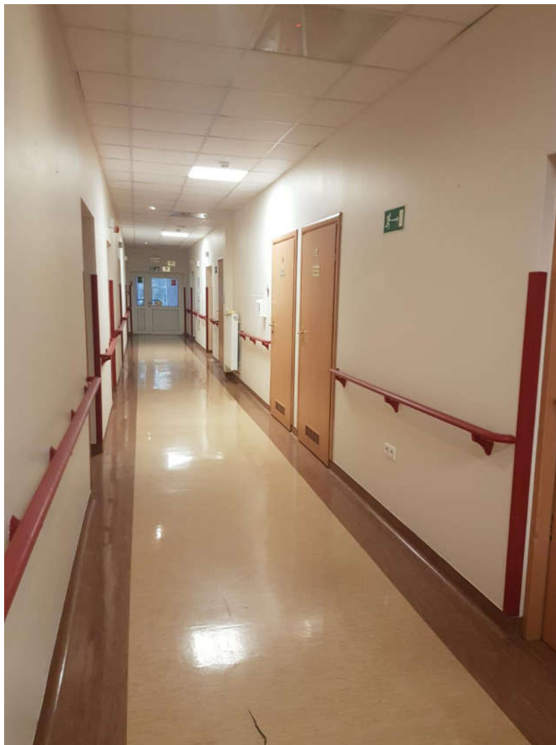
Efekt naszej pracy