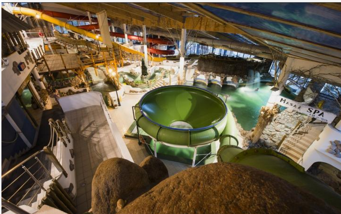
Aquapark w Pluskach - widok cebuli