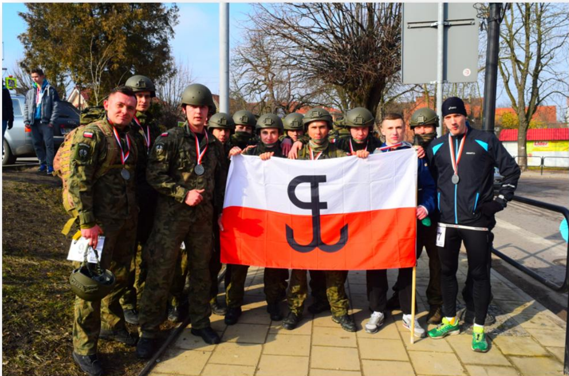
Pamiętkowe zdjęcie z uczestnikami biegu – 9 Warmiński Pułk Rozpoznania