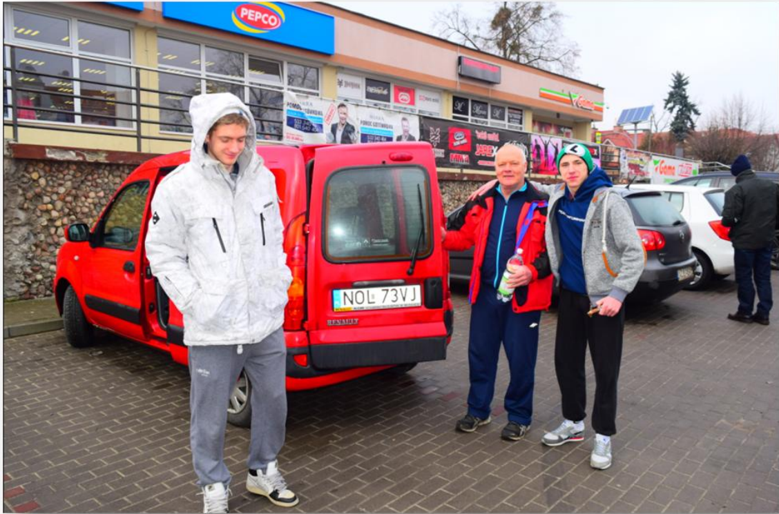
Przyjazd i przygotowywanie się do biegu