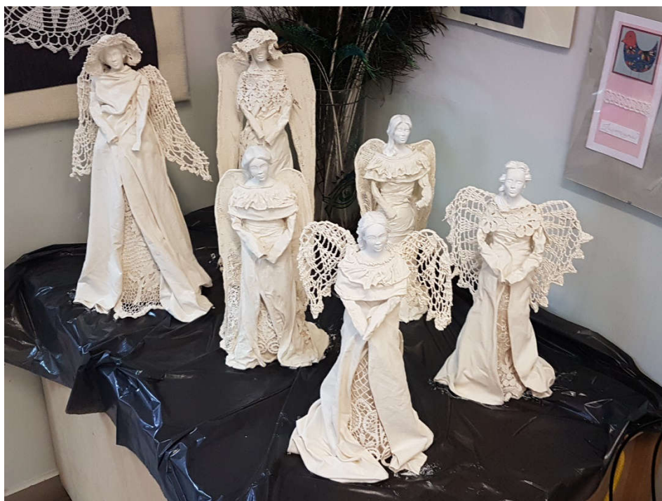
ANIOŁY DOBREGO SERCA KTÓRE ZROBILIŚMY